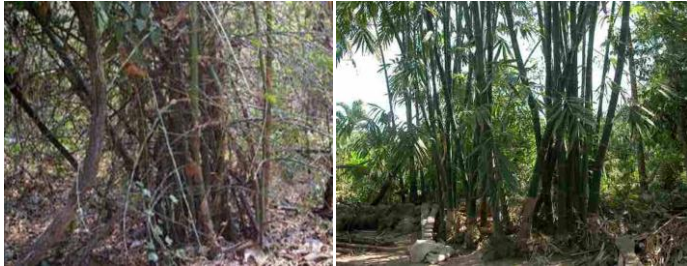
ដើមឫស្សីព្រៃ