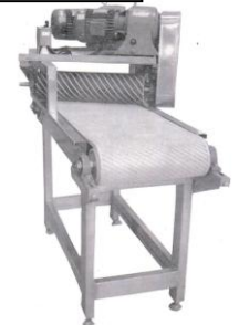
ម៉ាស៊ីនបកសំបក

ការកែច្នៃអាហារដែរ។ យើងត្រូវការកន្លែងធម្មតានិងមានការផ្គត់ផ្គង់អគ្គិសនីតែប៉ុណ្ណោះ។ ម៉ាស៊ីនកែបំប៉ន សង្វាក់ឧបករណ៍ពីប្រទេសចិន អាចរកទិញបានក្នុងតម្លៃ ២៥,០០០ ដុល្លារអាមេរិក សម្រាប់ខ្សែសង្វាក់ផលិតកម្មដែលអាចផលិតនិងវេចខ្ចប់ផលិតផលរសៈនិងសមតដ៍ចើន។