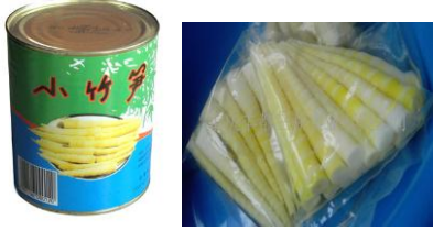
ទំពាំងស្រះនិងច្រកកំប៉ុង

ឯក្រៀមគឺគេអាចរកទិញបាននិងមានការពេញនិយមពេញមួយឆ្នាំ។ តម្រូវការប្រើប្រាស់ទំពាំងជាលក្ខណៈប្រពៃណីខ្ពស់បំផុតគឺក្នុងអំឡុងពេលសែនព្រះខែ (ភាគច្រើនទំពាំងក្រៀម) ចំណែកឯទំពាំងស្រស់ត្រូវបានប្រើប្រាស់នៅអំឡុងពេលនៃរដូវប្រមូលផល ទំពាំង។ ទំពាំងកែច្នៃទោះជាក្នុងលក្ខណៈ