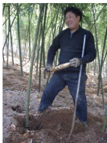
ការដាំទំពាំង

នាពេលបច្ចុប្បន្នធនធានទំពាំងនៅមានកម្រិតនៅឡើយទំពាំងស្រស់ និង ពាក់កណ្តាលការកែច្នៃដែលប្រើប្រាស់ នូវវិធីសាស្ត្របែបប្រពៃណីត្រូវបាន ប្រើប្រាស់លើប្រភេទពូជឫស្សីក្នុងស្រុកមួយចំនួន។ ចំការដាំដុះថ្មីត្រូវបានគេ ផ្តល់អាស្រ័យសាសន៍ថាត្រូវបានអភិវឌ្ឍន៍ជាមួយនឹងពូជដែលផ្តល់ភាពប្រសើរ បំផុតសម្រាប់ទីផ្សារគោលដៅ។ ការអភិវឌ្ឍន៍នេះអាចត្រូវបានធ្វើឡើងដោយ សហការណ៍ជាមួយនឹង អាជ្ញាធរក្នុងស្រុកនិងកសិករ។ ផលិតកម្មដែលទើប នឹងចាប់ផ្តើមដែលមិនទាន់មានលក្ខណៈជាក់ លាក់ដោយប្រើប្រាស់នូវផលិត