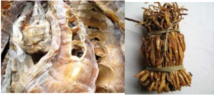
ទំពាំងក្រៀម

ទំពាំងគឺជាពន្លកទំពាំងខ្ចីដែលផ្តល់នូវប្រភពអាហារជាបន្លែដ៏សម្បូរបែបដែលសម្បូរទៅដោយវីតាមីននិងសារធាតុរ៉ែ។ ដោយសារមានការរីកចម្រើននៅក្នុងបច្ចេកវិទ្យាទំពាំងកែច្នៃទំពាំង