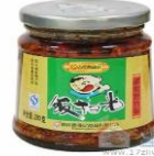
ទំពាំងគ្រាំនិងប្រឡាក់ក្រៀម

Contact information: ww.aha-kh.com/bamboo bamboo@aha-kh.com +855 89 595 668 (English) +855 12 550 635 (Khmer)