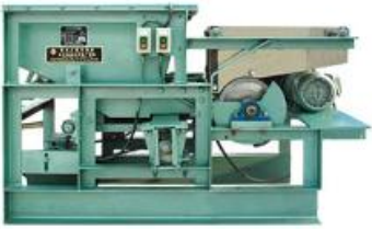
ម៉ាស៊ីនសម្រេចក្បាលចម្លឹះ

១. បច្ចេកវិទ្យាកម្រិតទាប គឺមានលក្ខណៈសាមញ្ញបំផុតនិងត្រូវការ វិនិយោគដើមទុនទាបបំផុត ប៉ុន្តែអត្រាប្រើប្រាស់វត្ថុធាតុដើមឫស្សី គឺមានកម្រិតទាប(៨ទៅ១០%)។ ប្រការនេះបង្កឲ្យមានការខ្វះខាត និងមានកាកសំណល់យ៉ាងច្រើនហើយតម្លៃពាណិជ្ជកម្មគិតជាប្រាក់ចំណេញនៃផលិតផលសម្រេច មានកម្រិតទាប។