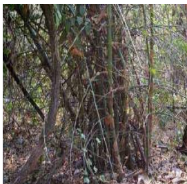
ឫស្សីព្រៃ

ការវាយតម្លៃលើធនធានដើមឫស្សីនៅក្នុងស្រុកវ៉ារិនខេត្តសៀមរាបបង្ហាញថាពូជឫស្សីនិងបរិមាណសមស្របមានគ្រប់គ្រាន់។ ផែនការគាំទ្រចំពោះការអភិវឌ្ឍន៍ការដាំដុះដើមឫស្សីនិងធានាដល់ការ ផ្គត់ផ្គង់រយៈពេលយូរ។ ឫស្សីព្រៃ គឺជាវត្ថុធាតុសមស្របមានច្រើនលើស លុប។ រោងសិប្បកម្មតូចមួយ ជាមួយបច្ចេកវិទ្យាកម្រិតទាបដោយផលិតបាននូវផលិតផលសម្រេច ៣០តោនក្នុងមួយឆ្នាំ នឹងអាចប្រើប្រាស់ដើម ឫស្សីស្រស់ចំនួន៣០០តោន នៅក្នុងមួយឆ្នាំ។ ខណៈដែលរោងចក្រដែលមានបច្ចេកទេសកម្រិតខ្ពស់ ដោយមានសមត្ថភាពផលិត ២៥០តោននៅក្នុងមួយឆ្នាំត្រូវការដើមឫស្សីស្រស់១០០០តោននៅក្នុងមួយឆ្នាំ។